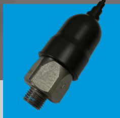
Sensor de caixa basculada para semirreboque