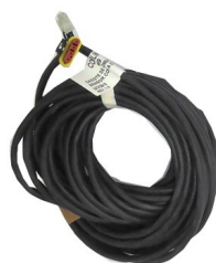
Cabos e conectores inclusos