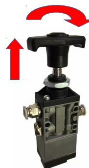
Válvula duplo acionamento (opcional).