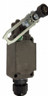
Sensor de caixa basculada (opcional).