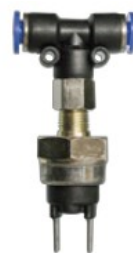
Sensor de tomada