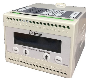
Cód. 5504 P1150 - Medidor de célula de carga com display