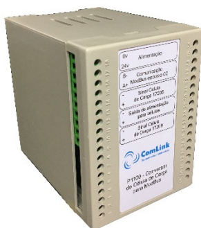
Cód. 4732 P1100 - Medidor de célula de carga